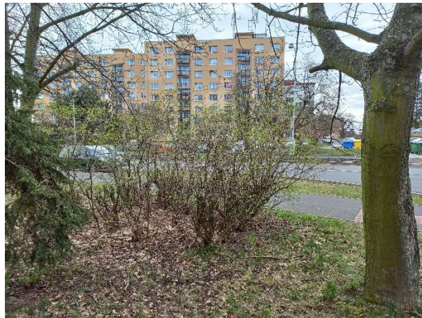
Pohled vlevo vzad