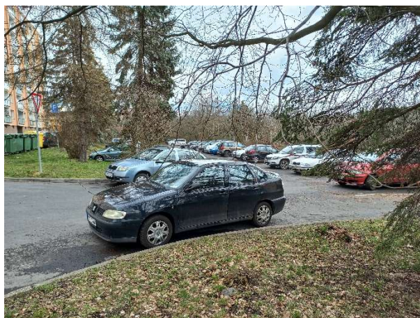
Pohled vpravo vzad